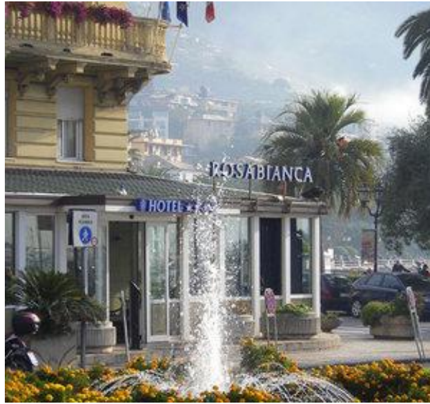
LUNGOMARE VITTORIO VENETO 42 – RAPALLO